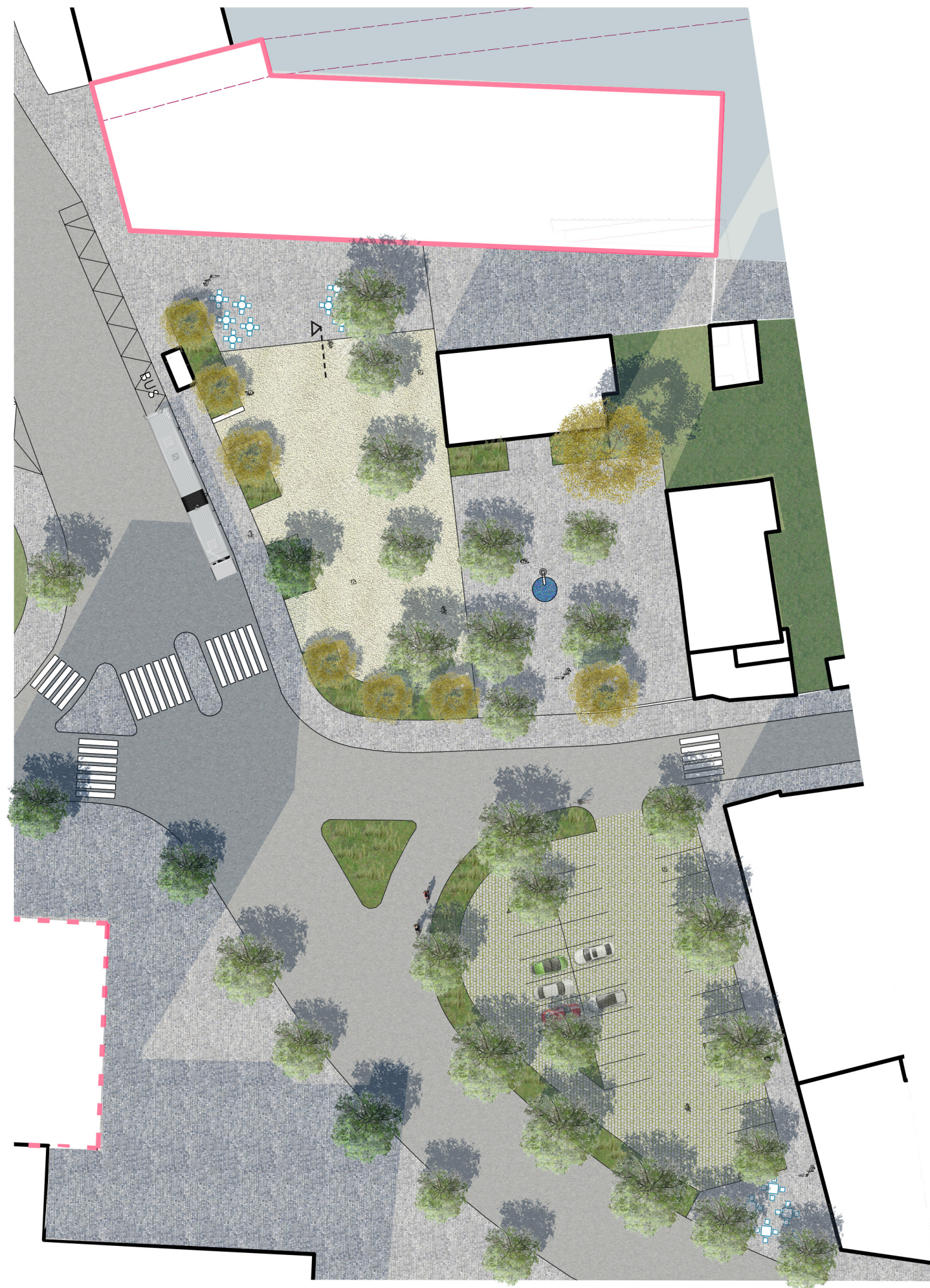
Lokální náměstí b. – detailní situace (Michelská x Ohradní) M 1 : 500